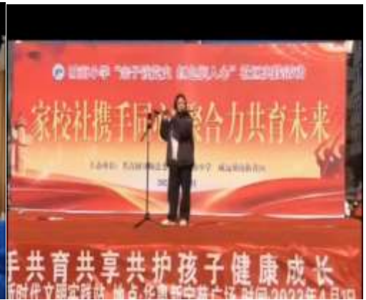
互助县城东小学支教点