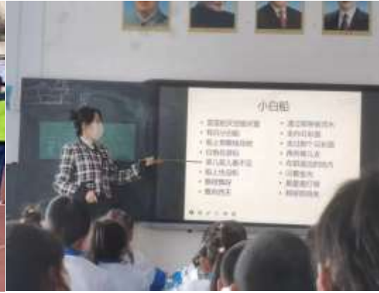
互助县城南小学支教点