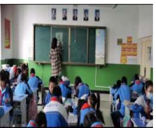
互助县台子乡中心学校支教点