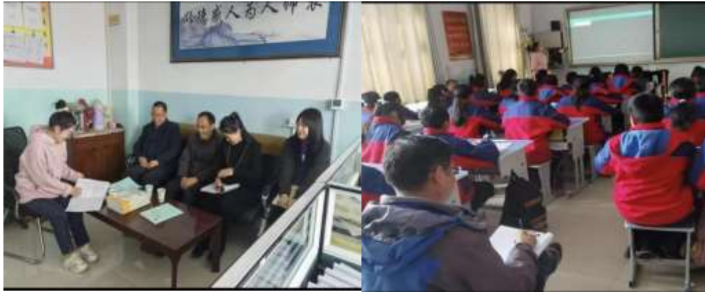
互助县塘川镇中心学校支教点