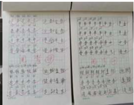
互助县哈拉直沟乡中心学校支教点