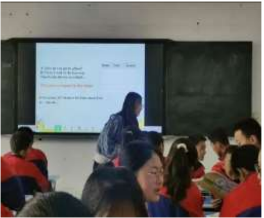
互助县威远镇中心学校支教点