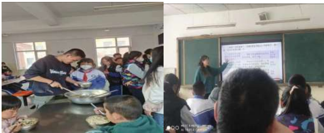
互助县丹麻镇中心学校支教点