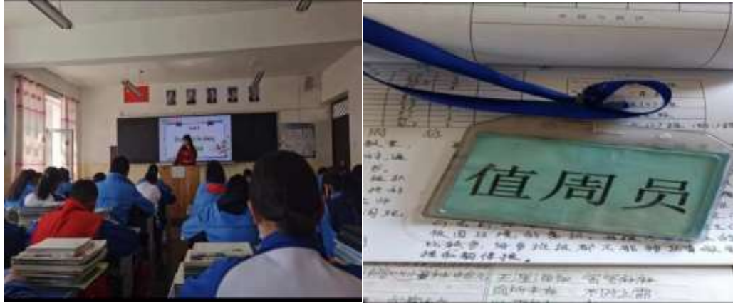
互助县加定镇中心学校支教点