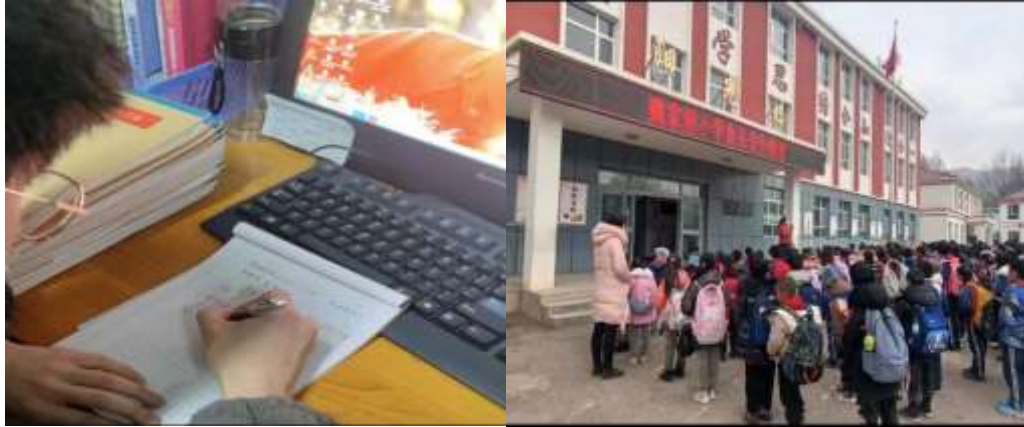
互助县南门峡镇中心学校支教点